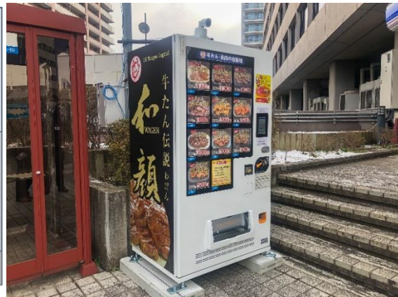
みやぎ・みちのくカイトク市場